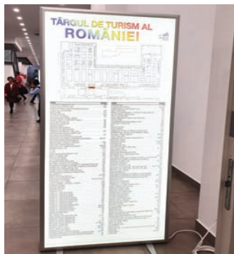
CASETA CU RAMA CLICK, DIMENSIUNE 52.5X106.5 CM