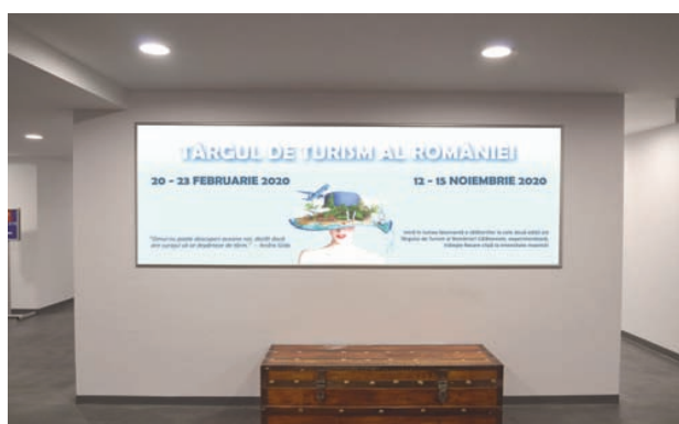
AFISARE BANNERE PAVILION A, FRIZA 7.70