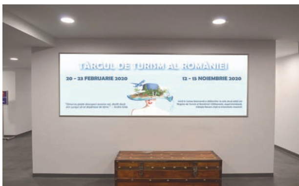
AFISARE BANNERE PAVILION A, FRIZA 7.70