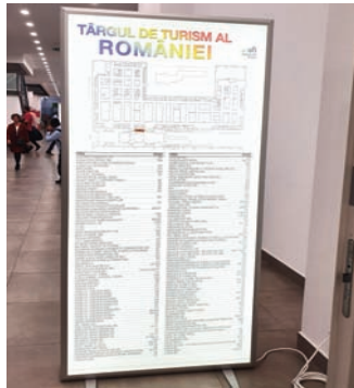
CASETA CU RAMA CLICK, DIMENSIUNE 52.5X106.5 CM