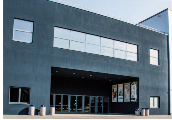
aFisaRe banneR PolicaRbona t in inteRioRul PaVilioaneloR b, DeasuPRA semnaliZarii