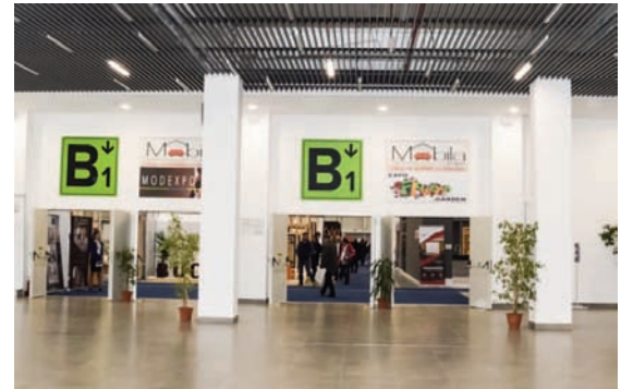
caset a cu Rama click, Dimensiune 196.5x137 cm