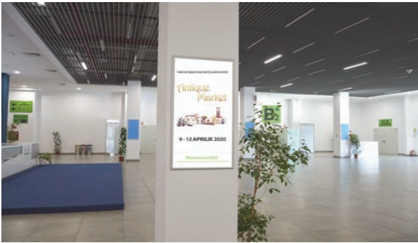
caset a cu Rama click, Dimensiune 301x106.5 cm