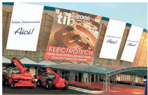
AFISARE BANNERE PAVILION A FRIZA 4.50