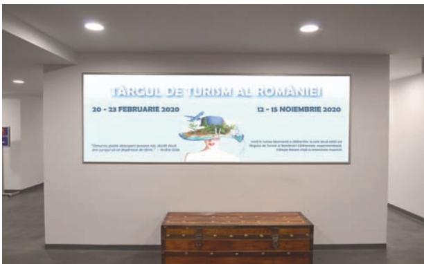
aFisaRe banneRe PaVilion a, FRiZa 7.70