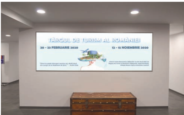
AFISARE BANNERE PAVILION A, FRIZA 7.70