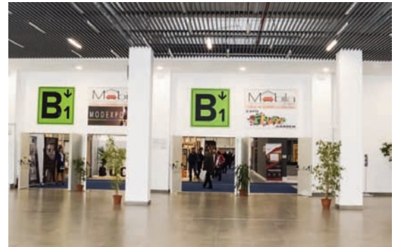
CASETA CU RAMA CLICK, DIMENSIUNE 196.5X137 CM