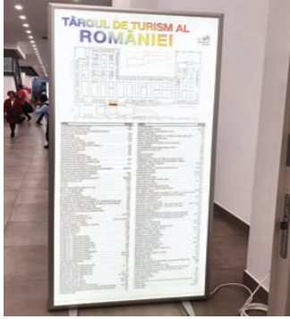
CASETA CU RAMA CLICK, DIMENSIUNE 52.5X106.5 CM